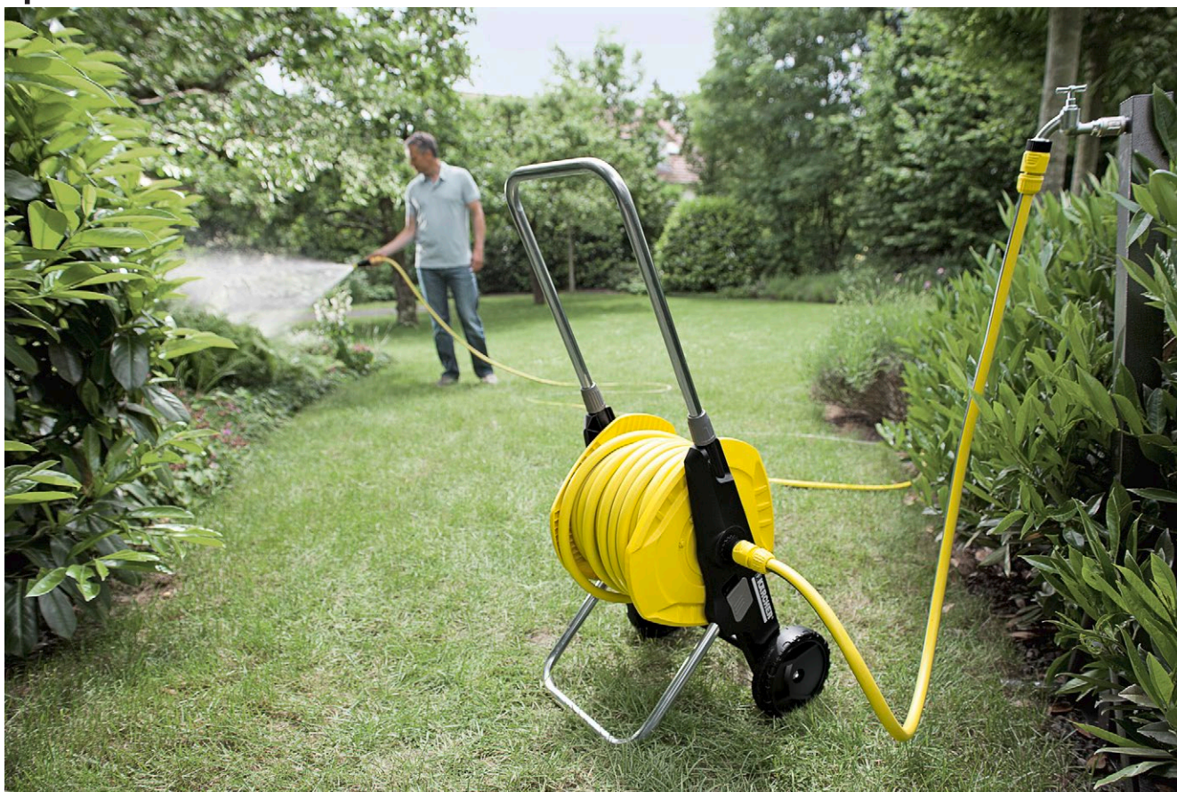
Тележка со шлангом 1/2" НТ 3.420 (в комплекте)